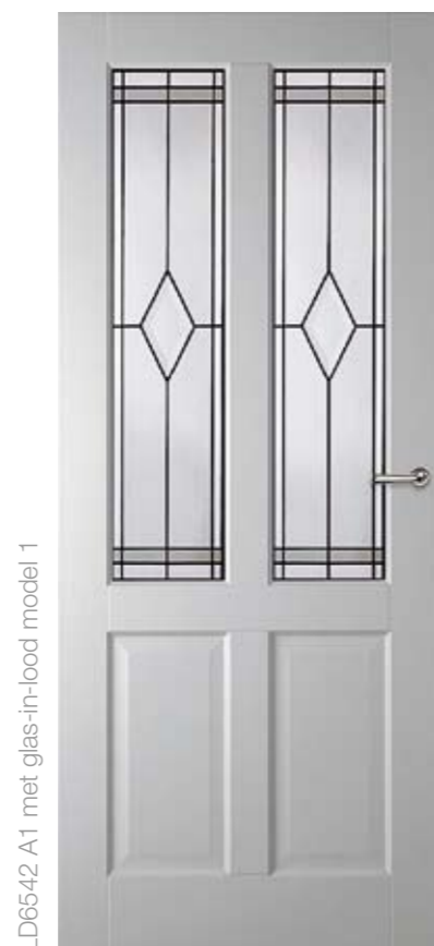
LD6542 A1 met glas-in-lood model 1

Kijk voor alle mogelijkheden op de koopwijzer achterin deze brochure.