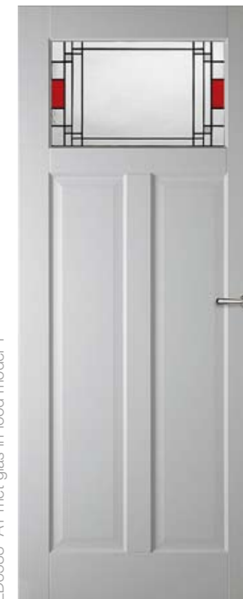
LD6583 A1 met glas-in-lood model 1