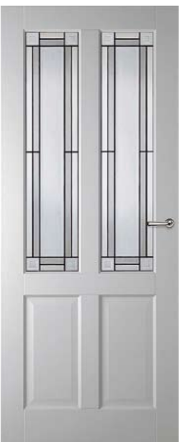
LD6542 A1 met glas-in-lood model 2