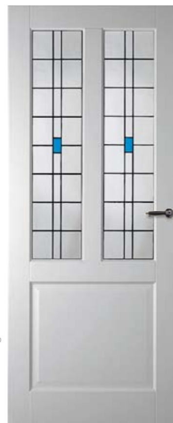
LD6552 A1 met glas-in-lood model 3