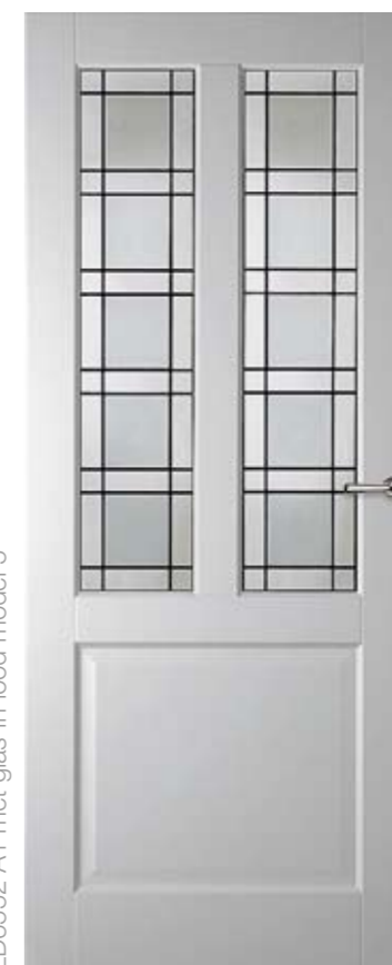
LD6552 A1 met glas-in-lood model 5