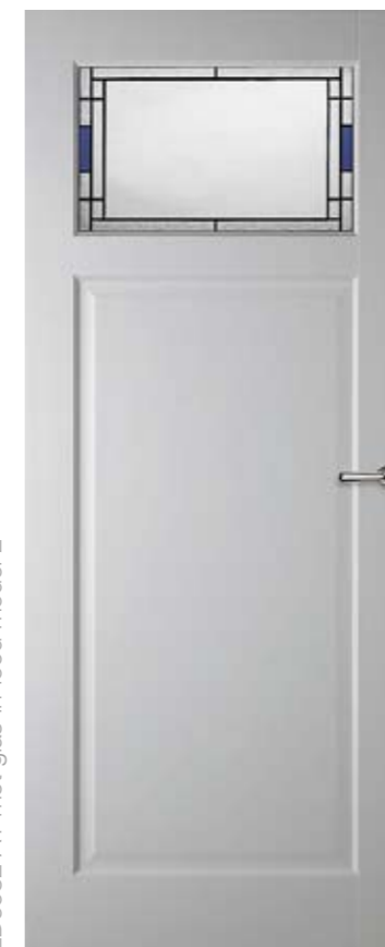
LD6582 A1 met glas-in-lood model 2