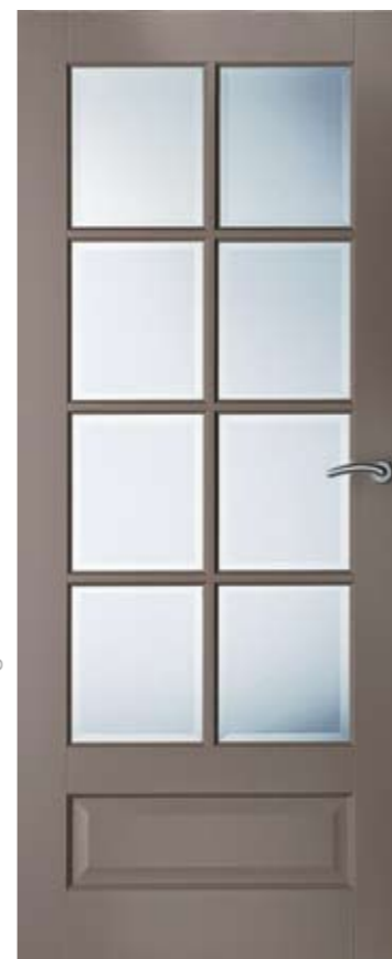
LD6562 A1 met mat facetglas