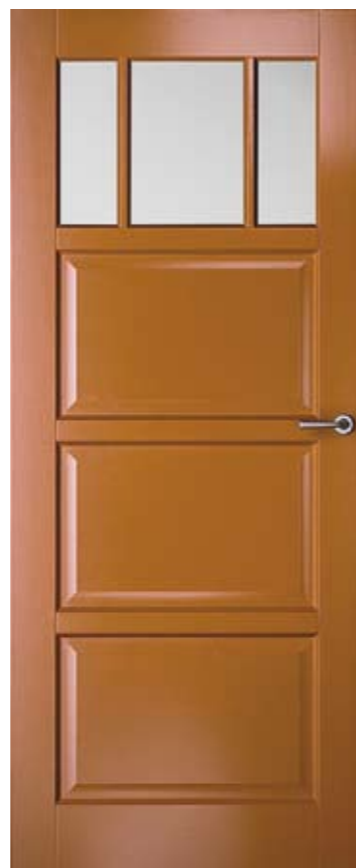
LD6515 A1 met mat glas