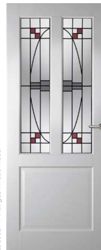
LD6552 A1 met glas-in-lood model 4