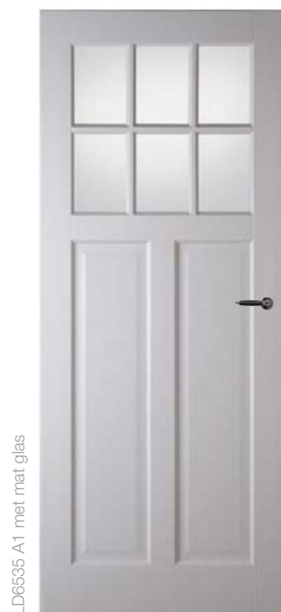
LD6585 A1 met mat glas

Bij een huis uit de 19e eeuw past ander glas-in-lood dan bij een huis uit de jaren 30. Living Doors heeft het allemaal.